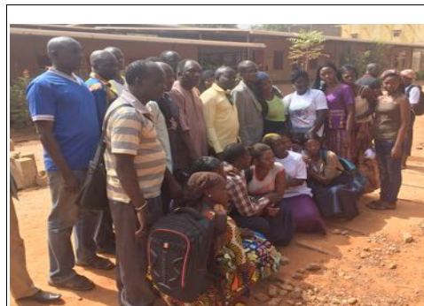
Quelques participants à la conférence

Deux soirées de suite, la jeunesse sikassoise avait de quoi se détendre. Le site principal des