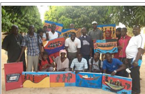
Participants à l'atelier 'Peinture'

Des ateliers pratiques artistiques autour du thème de l'immigration ont été organisé dans l'après-midi du 25 novembre au Centre Sénoufo. Il s'agissait de trois ateliers : sur la poésie avec Drissa Dembélé, sur la peinture avec Daouda Traoré et sur le Slam avec Abdoulaye Bengaly. 15 tableaux qui sont des œuvres des participants à l'atelier en peinture ont été exposés lors de la dernière soirée à l'espace Cicaara. Une pièce écrit par les participants à l'art de slam et deux poèmes rédigés par les participants à l'atelier de la poésie sont ci-joints. Ce n'est qu'un début timide mais aux résultats formidables. Il faut garder le flambeau allumé et ne pas céder au découragement.