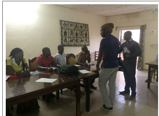
Participants à l'atelier des 'Slameurs'